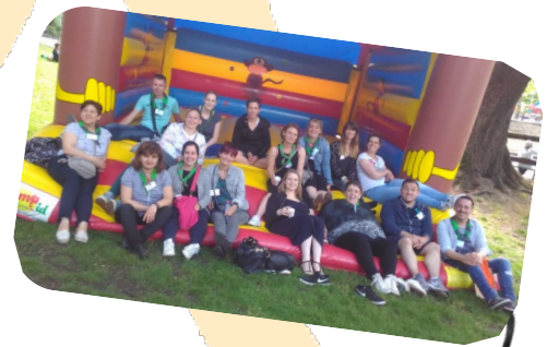
Equipe Enfance Education