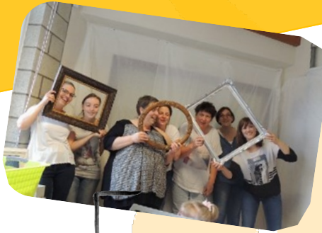
Equipe de la crèche