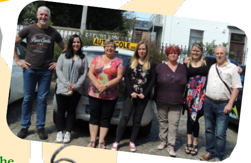
Equipe de l'auto-ecole sociale