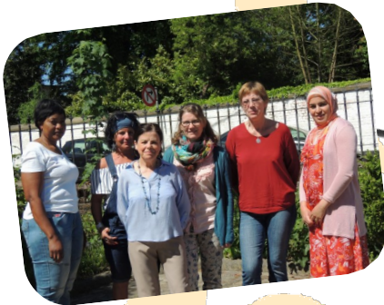
Equipe Services aux Personnes