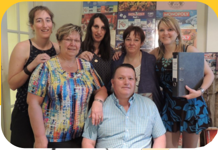
Equipe administrative et la directrice f.f.