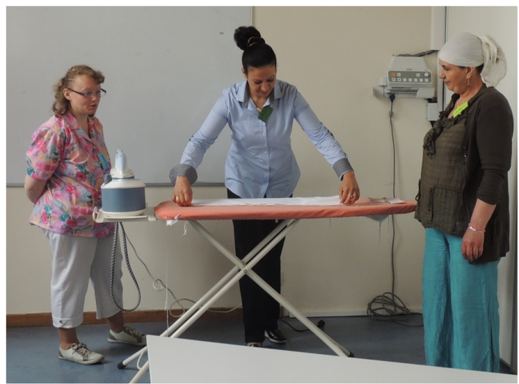
Démonstration de techniques de repassage