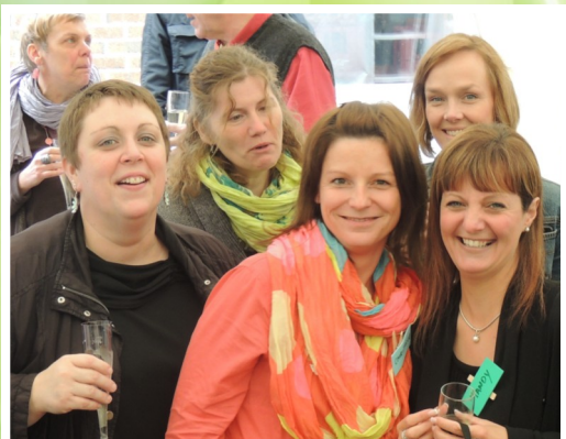
L'équipe de la crèche