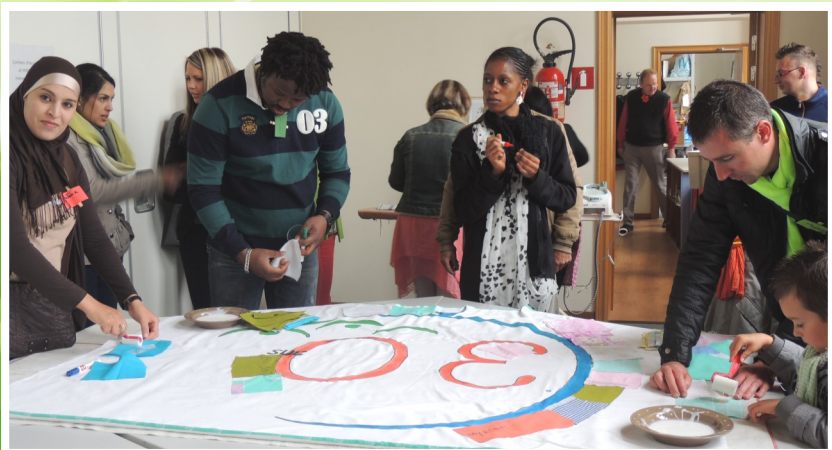
L'atelier de l'équipe « Service au personnes »