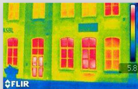
Photo infrarouge de notre façade montrant que nos radiateurs ne sont pas équipés d'une feuille isolante