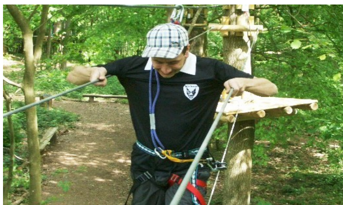
Sortie pédagogique à Natura Parc : sensibilisation à la sécurité en hauteur & team-building