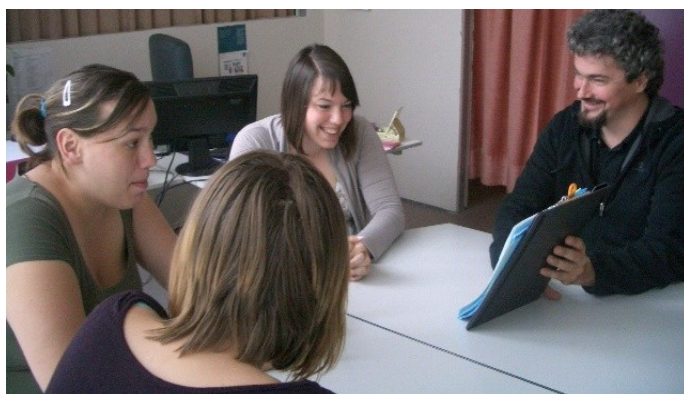
Suivi psychosocial de groupe